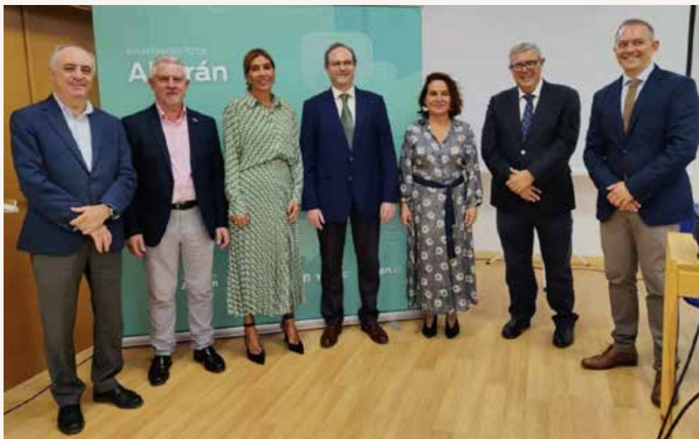
Imagen tomada el día de la jornada