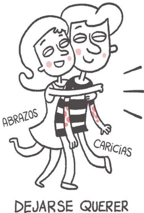
Ilustración cedida por Juanjo Fernández.

Fernández lleva cinco años con un tratamiento, que ha eliminado las placas de su piel, y con una terapia, que le permite abordar la vida de forma positiva. Presume de ir a la playa y de caminar en pantalón corto en el verano austral chileno. Pero hace dos décadas casi se da por vencido. “Llegué a un punto en que dije que hasta aquí no más”, cuenta. El 5% de los enfermos de psoriasis presenta riesgos suicidas, según la psicóloga.