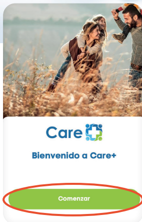
Captura de pantalla de la aplicación Care+

Una vez instalada, el icono de Care+ aparecerá en la pantalla de tu dispositivo